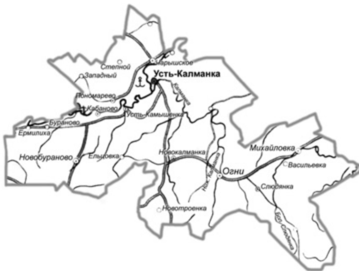
Рис. 2. Карта-схема МО Усть-Калманский район Алтайского края.

Среднегодовые температуры изменяются от -1,5\text{ }^{\circ}\text{C} до 2,3\text{ }^{\circ}\text{C} . Безморозный период составляет 120-130 дней.